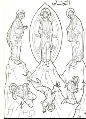
La Transfiguración del Señor