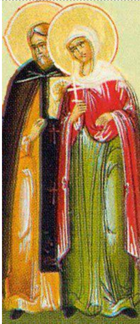
Los Santos Eulampio y Eulampia

Según la tradición cristiana, 200 soldados movidos por el valor de los dos hermanos, se convirtieron al cristianismo y también fueron martirizados.