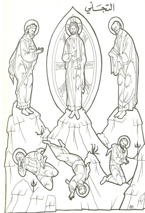
Transfiguración del Señor

تَجَلَّيْتَ أَيُّهَا الْمَسِيحُ الْإِلَهَ فِي الْجَبَلِ. وَحَسْبَمَا وَسِعَ تَلَامِيذُكَ شَاهِدُوا مَجْدَكَ. حَتَّى عِنْدَمَا يُعَابِنُوكَ مَصْنُوبًا يَقْطِنُوا أَنَّ الْآمَكَ طَوْعًا بِإِخْتِيَارِكَ. وَيَكْرِرُوا لِلْعَالَمِ أَنَّكَ أَنْتَ هُوَ بِالْحَقِيقَةِ شُعَاعُ الْآبِ.